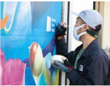
◀中野駅北口駅前広場の壁画制作の様子。身近な文化芸術を広げます